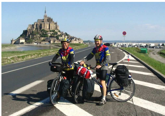
Ve Francii – před Le Mont-Saint-Michel

Postupem času jsem místo závodění upřednostňoval cykloturistiku a poznávání míst naší generaci desítky let zapovězených. První, nejdelší, nejsplyšnější a nejkrásnější byla expedice v r. 2005 od zámku v Blatné po stopách mírového poselstva krále Jiřího z Poděbrad. Předlohou byla kniha A. Jiráka „Z Čech až na konec světa“.