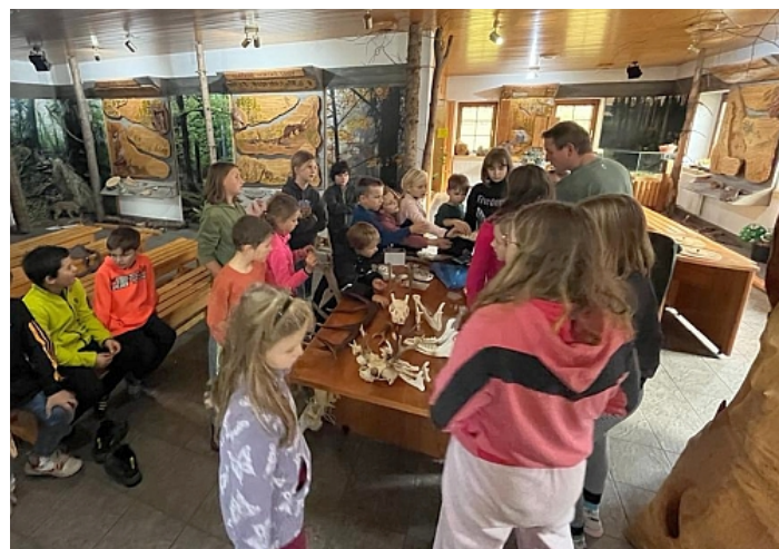
Návštěva informačního centra ve Stožci

Druhý den od rána poprchávalo, proto aktivity probíhaly uvnitř. Dopoledne nám paní koordinátorka ukázala drátkování stromů štěstí. Nejdřív se nám výrobek zdál náročný, ale začali jsme bojovat. Všude byly drátky, kamínky, korálky, ... a po dvou hodinách byly první výrobky na světě. Ve finále se všem povedl krásný strom, který jsme si všichni odvezli domů.