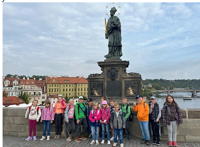
Zábořáci na Karlově mostě

V polovině října vyrazili zábořští druháčci a třetáčci do centra našeho hlavního města. Jejich hlavním cílem byla plavba lodí po řece Vltavě, návštěva tzv. Pražských Benátek. Potom se prošli po Karlově mostě a navštívili jeho muzeum.