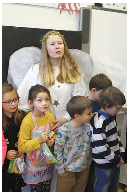
Děti pod andělskou ochranou

„Zlobili jste? Nosíte úkoly? Pomáháte doma mamince?“ To byly nejčastější otázky, které pokládal Mikuláš dětem 5. 12. u nás v zábořské škole.