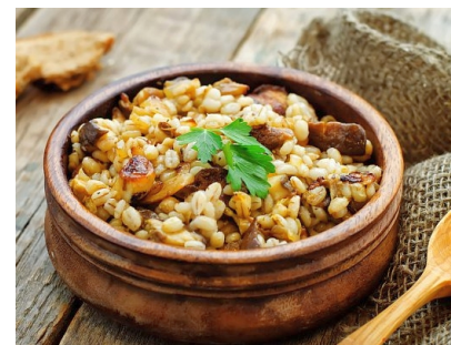
Vánoční jihočeský kuba

K oblíbeným jídlům patřil kuba z kroupk, s uzeným masem nebo houbami. Nesměla chybět kaše, ať už z jáhel, prosa, krupice nebo hrachu. Vánočky jsou tradiční součástí štědrovečerní hostiny i v současnosti. Jejich příprava snad kdysi souvisela