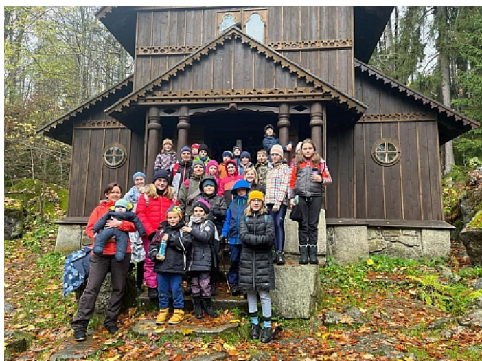
Před stožeckou kaplí

Na školní výlety se obvykle jezdívá v létě. My jsme se rozhodli tuto tradici porušit a naplánovali jsme exkurzi na podzim. Ráno 14. listopadu jsme nevyrazili jako obvykle do školy, ale naše kroky směřovaly na vlakové nádraží ve Strakonících. Cesta rychle ubíhala a všichni jsem se těšili na konečnou stanici Stožec. Tam na nás čekali pracovníci SEV, kteří zajistili ubytování v historické budově a připravili pro nás výukové programy na oba dva dny výletu.