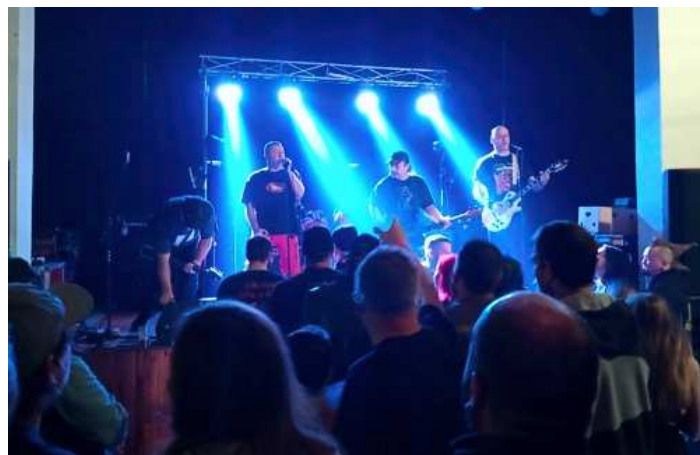
Punk není mrtvý – E!E

Vision Days svým bezmála dvouhodinovým vystoupením výborně rozhýbali posluchače a rozproudili energii. Když dohráli, čekalo se na hlavní hvězdy večera. Čekalo se na můj vkus docela dlouho, E!E začali hrát až po čtvrt na dvanáct, ale pak to stálo za to.