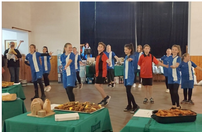
Vystoupení kroužku gymnastiky zábořské ZŠ

V sobotních podvečerních hodinách 4. listopadu jsem byla součástí již tradiční akce nazvané „Posvícenské řízkobraní.“ V sále kulturního domu v Záboří se konala soutěž o nejlepší řízek a posvícenskou hnětýnku.