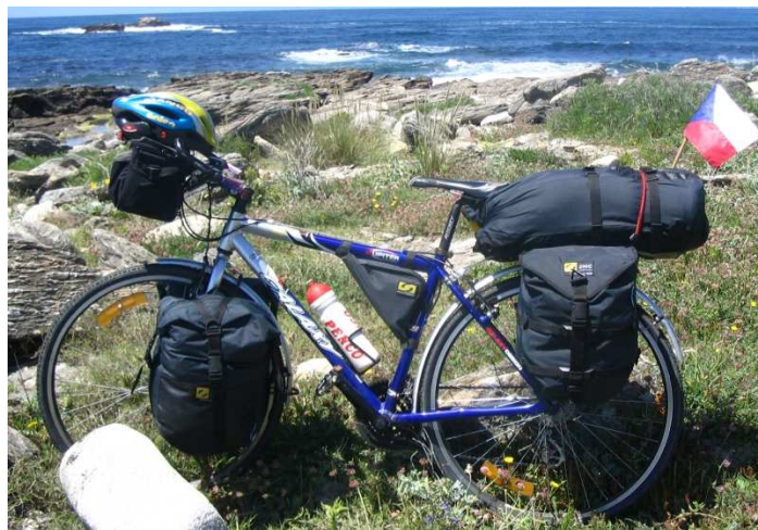
Toto kolo procestovalo svět křížem krážem

Jako kluci jsme jezdili na kolech našich tátů, možná i dědečků. První moje kolo bylo značky Eska sport. Později, když rodiče uvěřili svým hostům, aktivním cyklistům, že mám pro cyklistiku určité předpoklady, zakoupili mi první, skutečné závodní kolo zn. Favorit. Protože v té době bylo na běžném trhu naprosto nedostupné, zajistili mi jeho dodání přímo z továrny v Rokycanech právě cyklisti ze Sedlice. Všechna kola Favorit z tehdejší doby mají nyní vysokou sběratelskou hodnotu. Technika a kvalita se každoročně zlepšovala, zatímco vynikající továrna Favorit v Rokycanech bohužel zkrachovala. Nabídka kol a vybavení pro cyklisty byla po r. 1990 široká. Zůstal jsem věrný českým značkám. Jako dárek při odchodu do důchodu jsem si nechal ve firmě Kovařík vyrobit na zakázku závodní silniční speciál. Na něm jsem projel všechny silniční závody, maratóny i alpské průsmyky, známé z profesionálních závodů. Závody horských kol jsem jezdil na značce Rock machine. Ke svátečním vyjíždkám se vydávám na klenotu mezi horskými koly zn. Author Introvert.