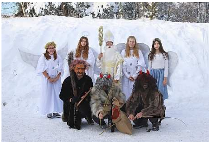
Mikuláše doprovodila i bohatá sněhová nadílka

řekly básničku a za to si odnesly balíček plný dobrot. Někteří zlobilové si naopak odpykali trest v podobě např. deseti dřepů. Někdy jsme pohrozili pytle a peklem, proto většina dětí slíbila, že už budou hodné a čerti odešli s prázdnou.