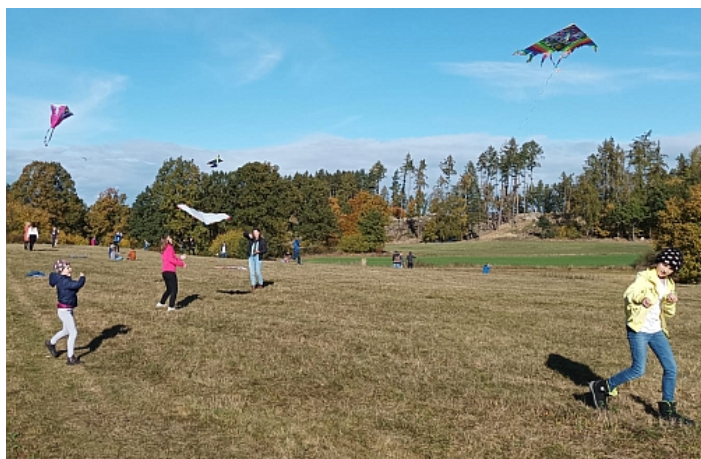
Obloha se pokryla papírovými draky

Jedno slunečné podzimní dopoledne věnovali žáci prvního stupně a 8. třídy pouštění draků. Louka u školy se jimi doslova zaplnila, hrála všemi barvami.