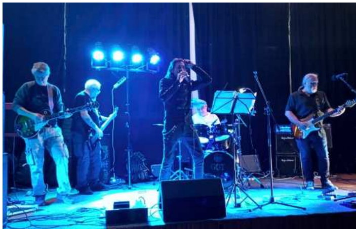
Skupina HRC PRC naposledy v původním složení

V pátek 13. 10. 2023 se do sálu Zábořské hospůdky, po více než dvaceti letech vrátila kapela HRC PRC a v původní sestavě zde odehrála svou poslední zábavu. Jako hosta si přivezli skupinu GGT, která se představila ve druhé polovině večera.