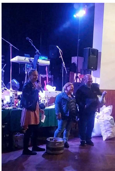
Vyhlášení nejlepších řízků