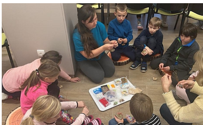
Výletníci si vyzkoušeli drátkování stromu štěstí

První celodenní výlet byla cesta za historií Stožecké kaple, během které jsme se seznámili s lesními ekosystémy a navštívili I. zónu NP Šumava. Poutní kaple Panny Marie byla postavena v první polovině 19. století u pramene léčivé vody, která pomohla kováři navrátit zrak. Pramen vody jsme objevili i my a na vlastní „oči“ jsme léčivou studánku vyzkoušeli.