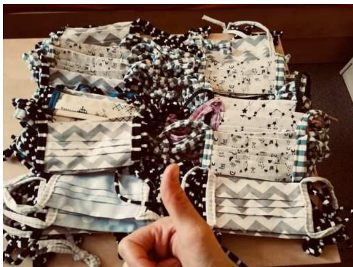
Roušky pro internu strakonické nemocnice

Šila jsem i sálové čepice, teď o víkendu mě ještě čekají čelenky s knoflíky na roušky pro sestřičky do Písku.